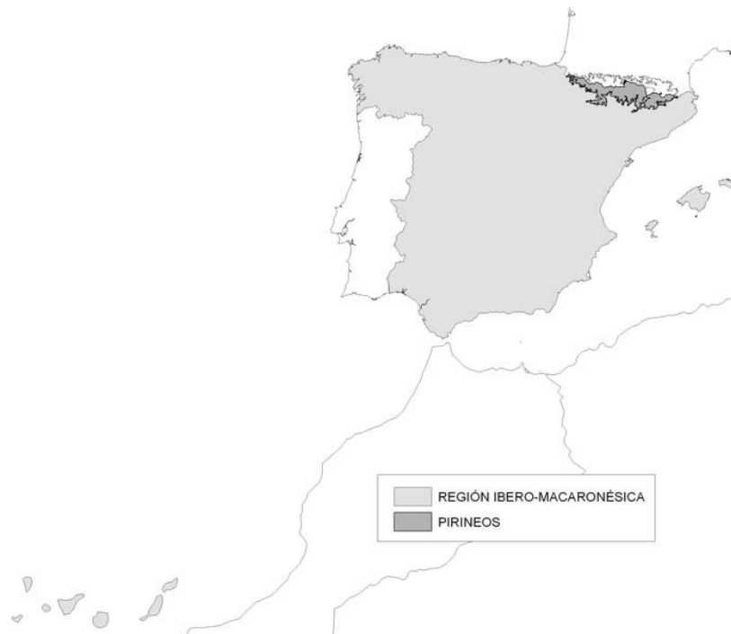
Figura 1. Regiones ecológicas de ríos y lagos

La región de los Pirineos queda delimitada por la zona pirenaica situada por encima de 1.000 m de altitud y comprende parte de la cuenca del Ebro y de las Cuencas Internas de Cataluña, según se detalla en la figura 2.