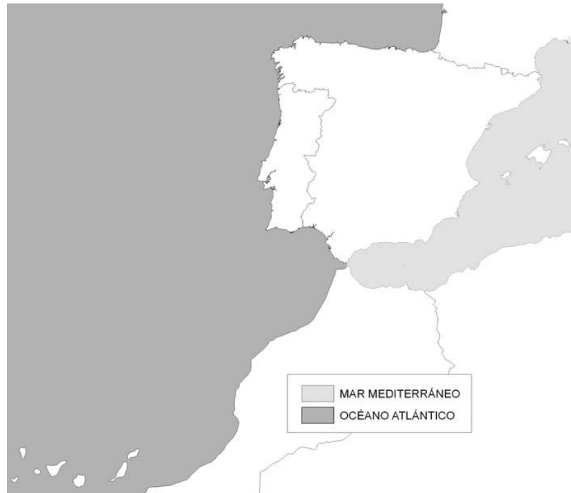
Figura 3. Regiones ecológicas de aguas de transición y costeras

Las regiones ecológicas de las aguas de transición y costeras serán el Océano Atlántico y el Mar Mediterráneo, como se muestra en la figura 3.