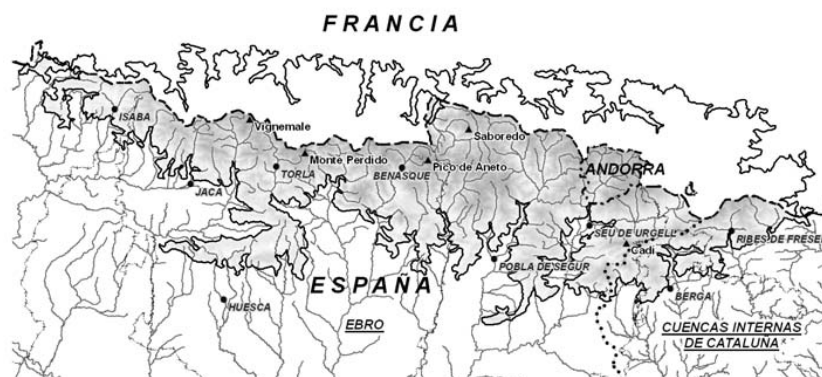
Figura 2. Detalle de la parte española de la región ecológica Pirineos

La región de los Pirineos queda delimitada por la zona pirenaica situada por encima de 1.000 m de altitud y comprende parte de la cuenca del Ebro y de las Cuencas Internas de Cataluña, según se detalla en la figura 2.