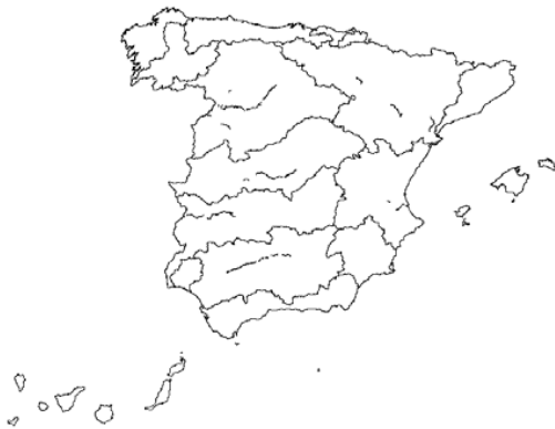
Tipo 17. Grandes ejes en ambiente mediterráneo